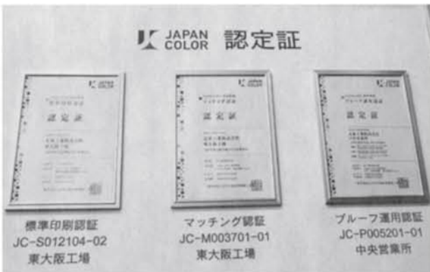
掲示された3つの認定証(東大阪工場)